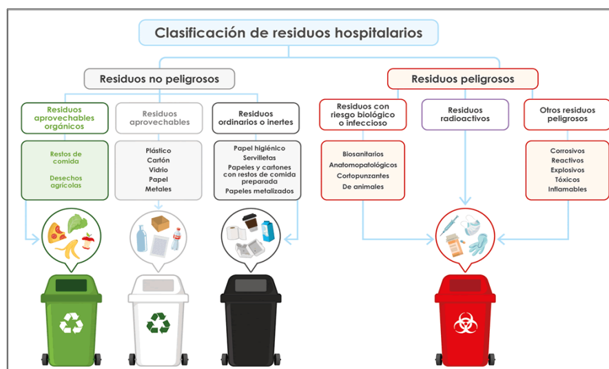
IMAGEN N° 02 CLASIFICACIÓN DE RESIDUOS HOSPITALARIOS