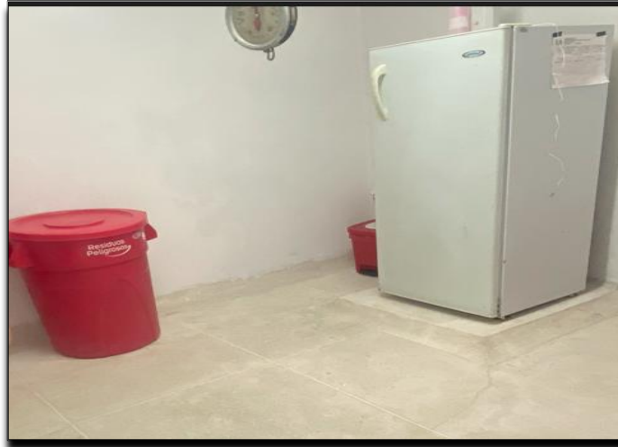
IMAGEN N°7 SISTEMA DE REFRIGERACIÓN HOSPITAL CENTRO