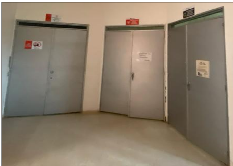
IMAGEN N°5 ALMACENAMIENTO CENTRAL HOSPITAL SAN JOAQUÍN

Esta acción consistente en depositar los residuos sólidos segregados en áreas definidas para esto, las cuales están diferenciadas en unidad de almacenamiento intermedio y unidad de almacenamiento central. Las áreas de almacenamiento intermedio, son un lugar cercano donde se ubican los contenedores para que el generador almacene temporalmente los residuos previos a la entrega a la unidad de almacenamiento central; estas áreas deben estar delimitadas por barrera física, fija, piso y techo además, está área debe estar iluminada y cerrada. En la siguiente IMAGEN se presenta el almacenamiento central en el Hospital San Joaquín.