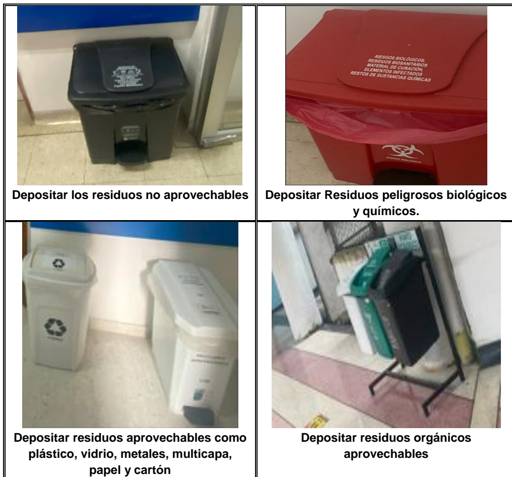
IMAGEN N°4 RECIPIENTES PARA RESIDUOS SÓLIDOS HOSPITALES ESE-SALUD

Es de anotar, que para facilitar la segregación de los residuos la entidad tiene recipientes o canecas en lugares visibles, con etiquetas que informan los posibles residuos específicos que contienen, etiqueta elaborada con la asesoría del profesional líder del proceso de gestión ambiental. Las siguientes imágenes muestran algunos de los recipientes que usa la entidad para hacer su separación.